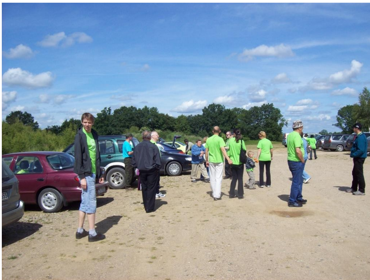
Uczestnicy rajdu na trasie samochodowej.