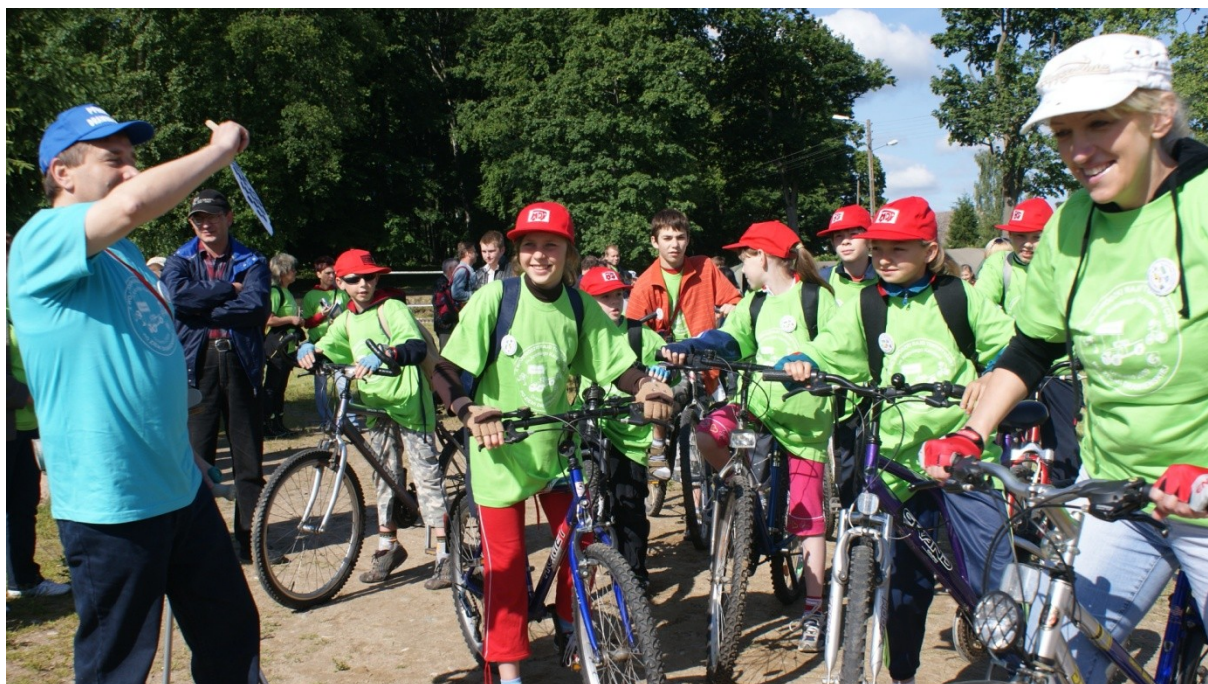
Start w kategorii rowerowej do X rajdu