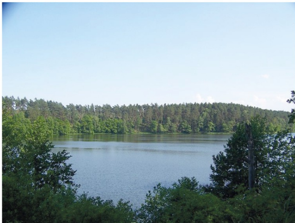
Widok na jezioro Ostrowieckie.

Druk foldera sfinansowano ze środków Wojewódzkiego Funduszu Ochrony Środowiska i Gospodarki Wodnej w Szczecinie. Wydawnictwo kolportowane bezpłatnie