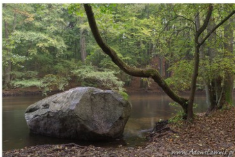
Drawieński Park Narodowy, rz. Drawa, Wydrzy Głaz.