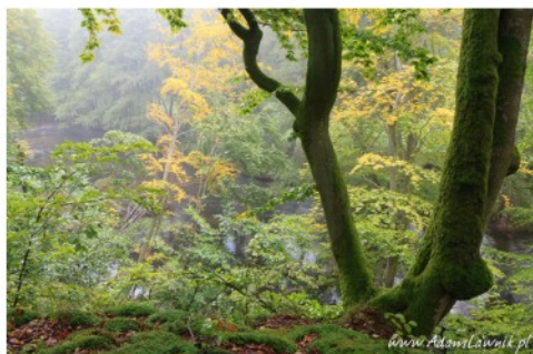
Drawieński Park Narodowy