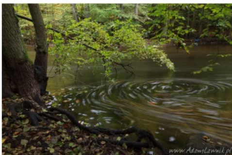
Drawieński Park Narodowy, rz. Drawa